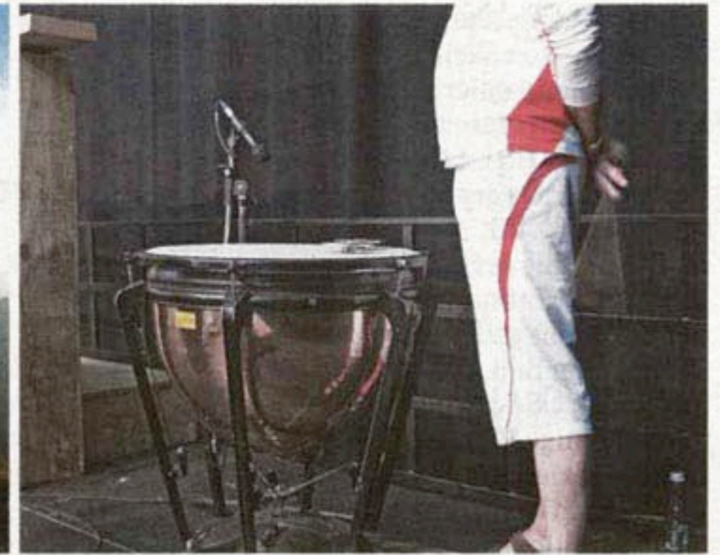
Die Kalkgipfel der Ennstaler Alpen bilden ein herrliches Panorama für zeitgenössische Musik: mit trommelnden und komponierenden Fabrikarbeitern, mikrotonalen